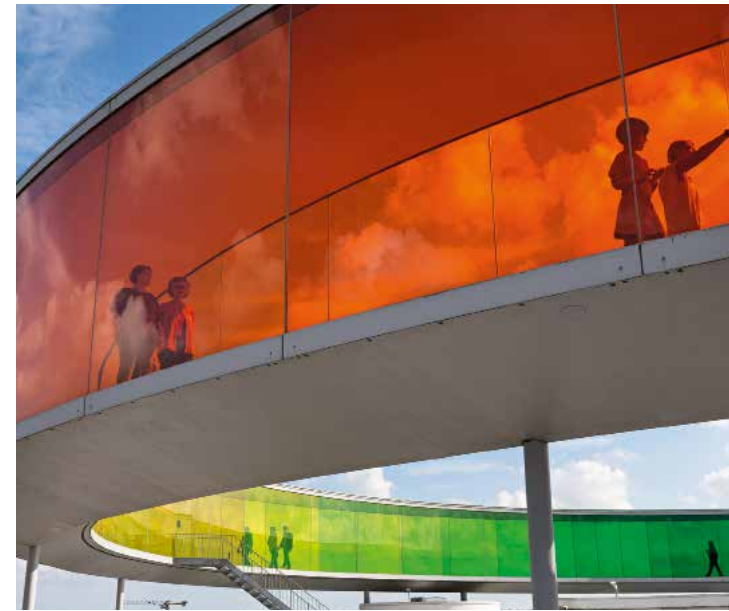
Die Dachinstallation auf dem AROs (oben) feiert die Moderne, im Freilichtmuseum Den Gamle By wird dänische Vergangenheit vorgeführt (rechts) The futuristic installation on the roof of the AROs art museum (above) counterpoints the open-air historical museum Den Gamle By (right)