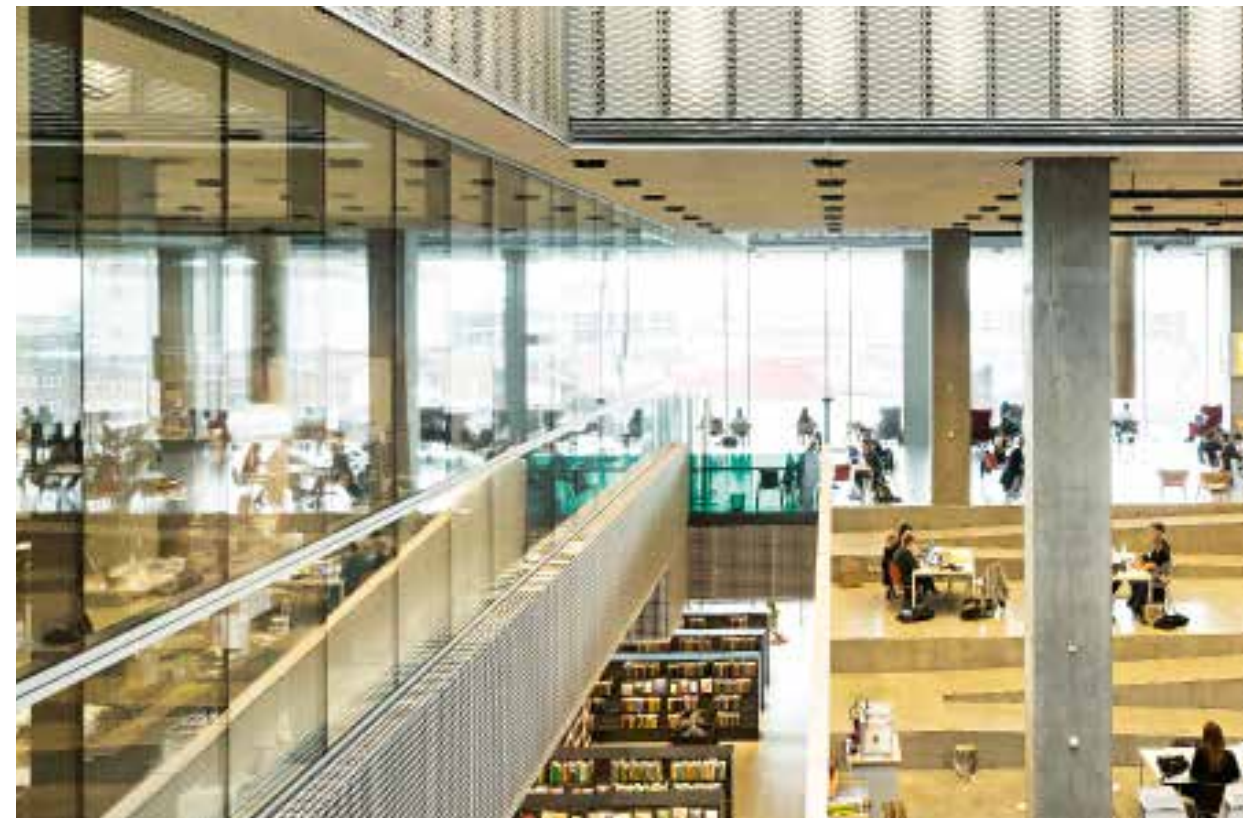
Die Stadtbibliothek Dokk1: Bücher, die zwei Jahre nicht entliehen wurden, werden aussortiert Dokk1, the city library where books have a shelf life of two years if nobody checks them out